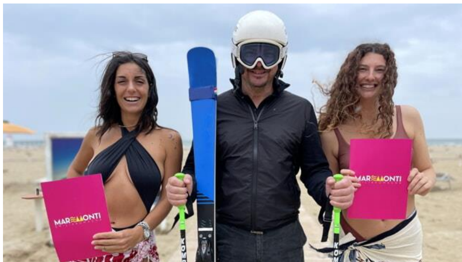
La presentazione di Mare Monti

Con Piacere Spiaggia Rimini dalle prossime settimane verranno proposti in riva al mare tantissimi piccoli eventi e attività come il risveglio muscolare, i tornei sportivi e l'animazione per i bambini