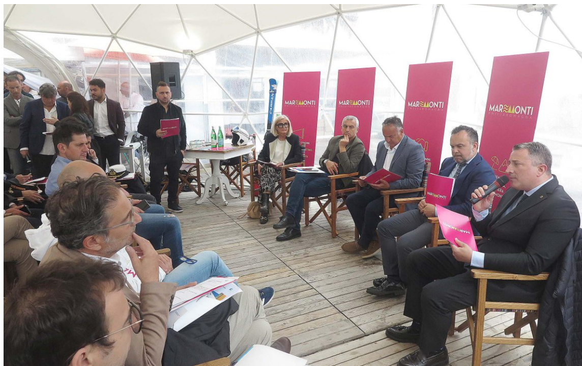
La conferenza di presentazione di ieri mattina ai bagni "Ricci di Mare"

quando per la prima volta sarà la montagna a sbarcare sulla spiaggia di Rimini. Un'unione che porterà alla realizzazione di un grande show inedito tutto da scoprire. In occasione questa edizione di "Un mare di rosa" ci sarà il debutto di Un mare di piadina, tutto rigorosamente in pink edition.