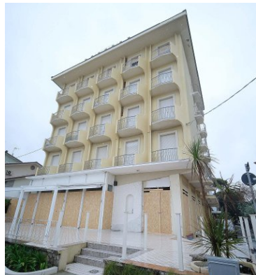
L'ex albergo La Bussola a Bellaria