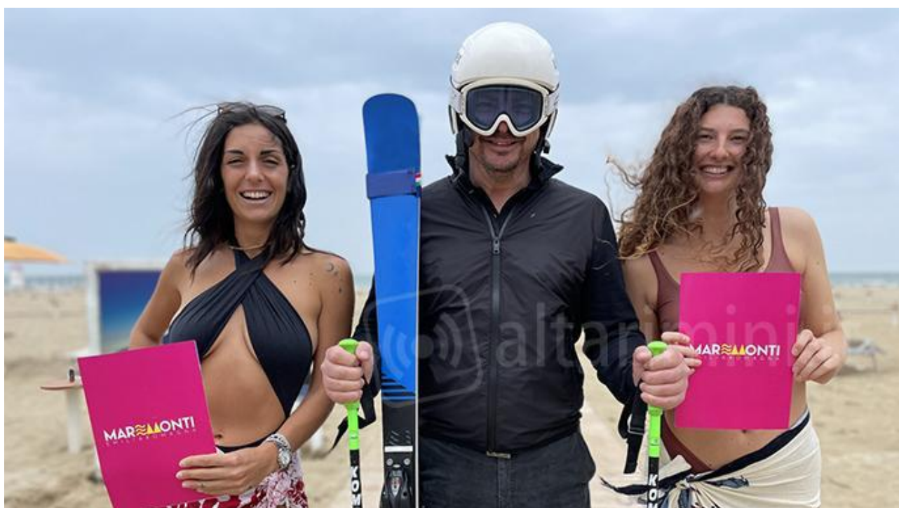
La presentazione di MareMonti, Rimini.

Dalle parole ai fatti. A metà marzo ci fu il primo incontro a Rimini condividere il progetto MareMonti e oggi eccolo, come grande novità, fra gli eventi protagonisti alla presentazione ufficiale delle iniziative estive in programma, a cura di Piacere Spiaggia Rimini .